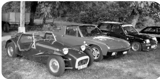
Sortie des anciennes juillet 2008 arrivée à Malval