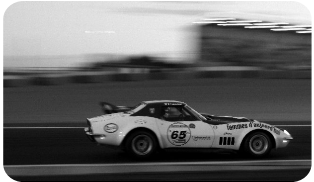
Pascal GAUDARD Chevrolet Corvette 1971 1 e GT Le Mans Classic